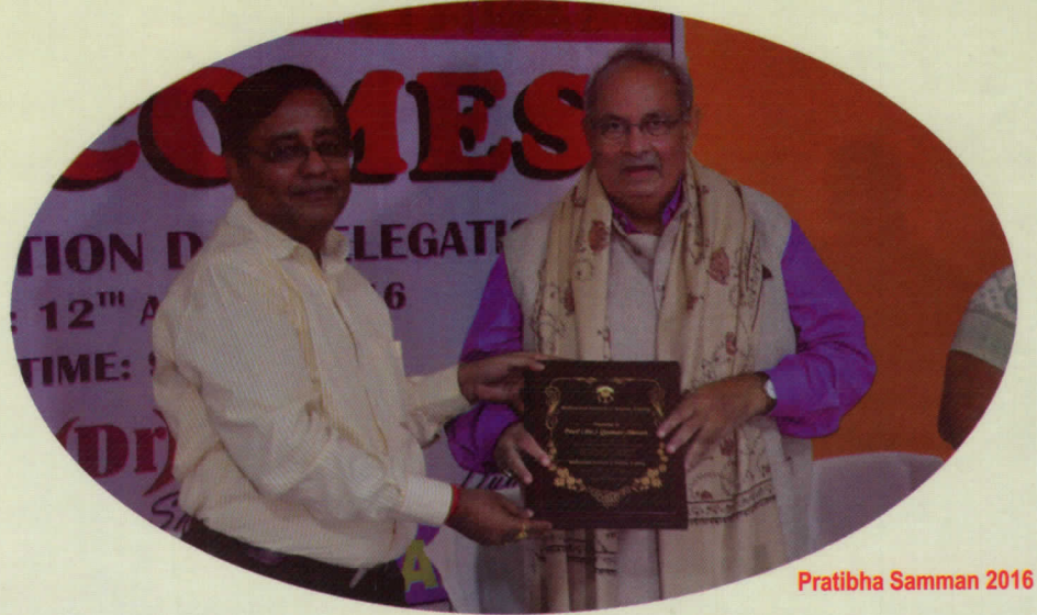
Pratiba Samman 2016