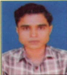
भास्कर मंडल संयुक्त सचिव